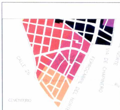
PLANO DE URBANIZACIONES